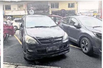
泊車位畫得太斜，很多車都泊在格子外了。

李仁英說，加影市區的泊車位全部劃錯，需要重新劃過。 他說，市議會在上一個月重鋪市區道路，預計重劃泊車位可以增加多一些泊車位，但不會加太多。