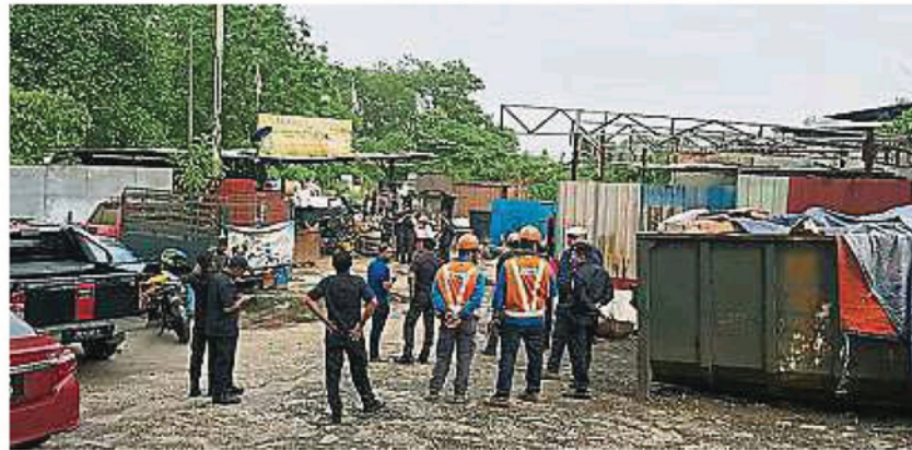
市议会星期二早上拉大队前往万挠区一家非法占用土地的烂铁厂展开拆除围篱行动。