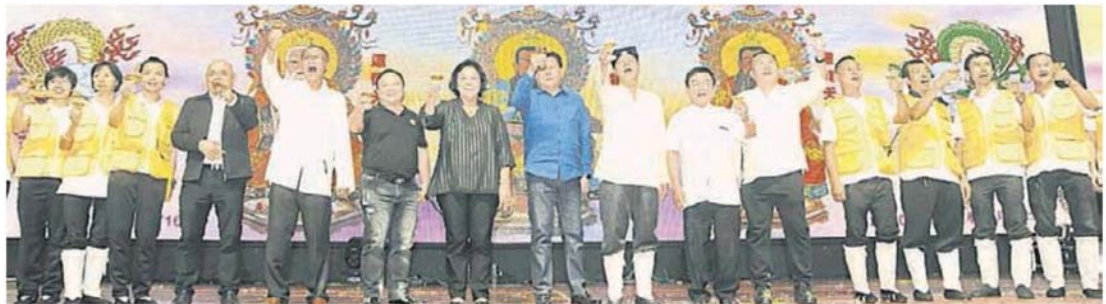
■ 龍福宮全體理事向來賓敬酒。

(吉隆坡22日訊)蕉賴九英里龍福宮為慶祝金龍王千秋寶誕，前日特在洗都王岳海礼堂禮堂舉辦“第17屆龍福宮之宴”聯歡午宴，該宮也喜慶不忘公益，特撥出8000令吉充作華教及慈善捐款！