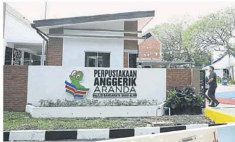
民众会堂「大翻身」，变成社区图书馆。市政厅耗资170万令吉，把使用率低的民众会堂