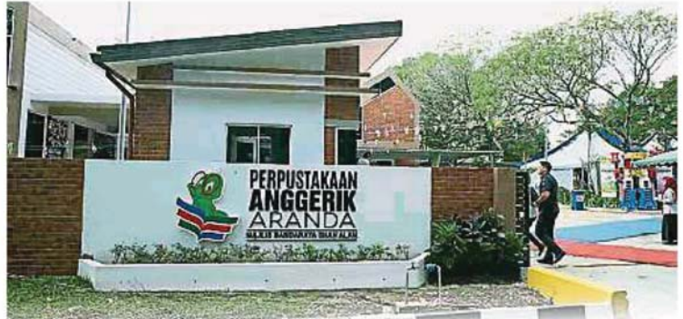
沙亚南市政厅把沙亚南19区的民众会堂旧建筑改头换面而成焕然一新的社区公共图书馆，以在该区打造阅读风气。