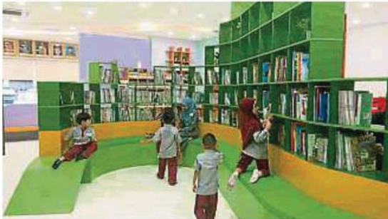
公共图书馆环境舒适宽敞，让儿童及民众能在一个舒适的环境下阅读。