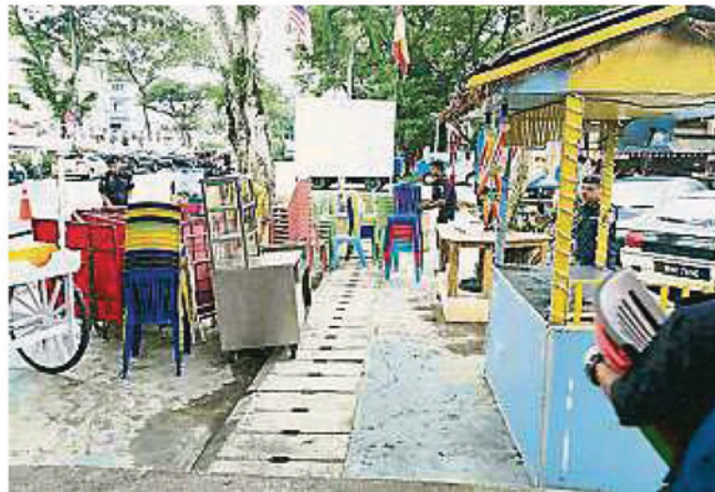
当局充公与搬走所有非法档口的物品，包括多张桌椅。

(士拉央22日讯)士拉央市议会执法与安全组今早与多个单位在鹅唛宝敦花园(Taman Bolton)展开联合取缔行动，拆除非法档口。