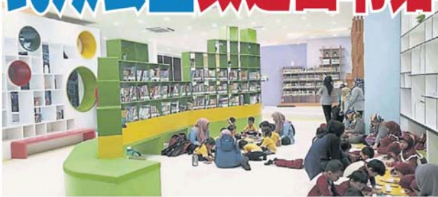
席地而坐, 让孩子能够随性、轻松阅读。

商讨及携手合作, 最终有关占地仅 0.27 亩的旧建筑, 获重新翻新及增添新元素, 成为现有藏书 6000 本的小型图书馆。