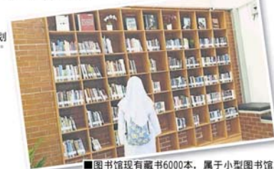
图书馆现有藏书6000本，属于小型图书馆。