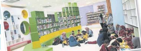
目前图书馆让大家席地而坐，孩子们能够随性、轻松阅读。