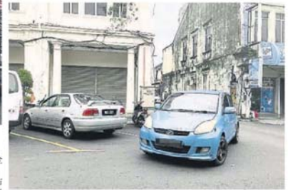
若根據泊車格泊車，從拉惹哈路轉入芙蓉街時，很容易撞上泊在路邊的車。