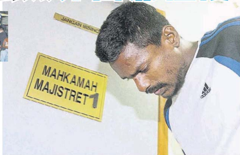
被告步入法庭时，全程低头，不愿面对媒体镜头。