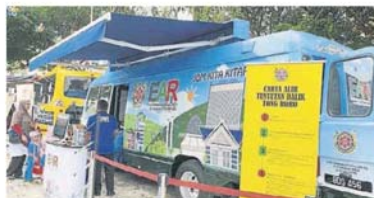
市规划，不时到各社区推动阅读图书。

他补充，实达阿南民众会堂地段较为不适合，主要原因是远离社区，因此市政厅仍在寻找合适地点，目前主要通过流动图书馆，在该区推广阅读风气。