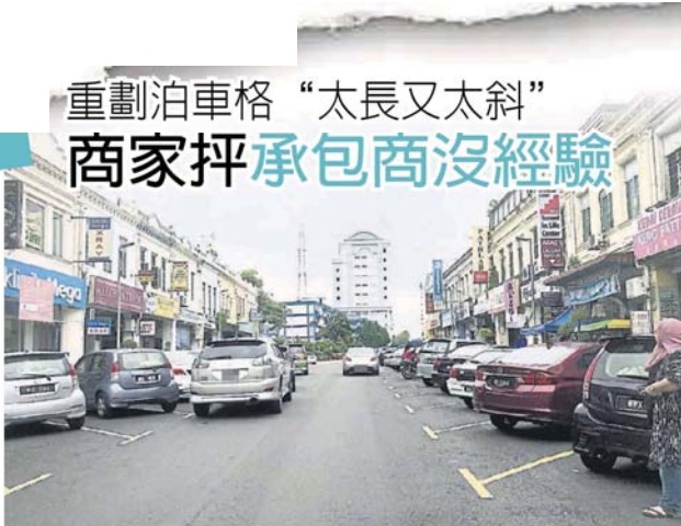
泊車位畫得太長，芙蓉街變窄了。

商家也指出，芙蓉街 (Jalan Sulaiman) 的泊車位劃得太長，使到芙蓉街感覺上變窄了。 “市區泊車位不足，很多客人會暫時雙重泊車，買了新泊車位後，再雙重泊車，整條路更窄。”