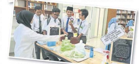
图书馆有许多用途，包括科学实验，让中学生有机会参与课本以外的学习过程。